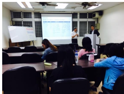
活動說明：師生合影