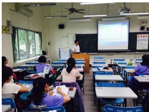
活動說明：師生合影